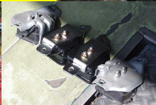
15mm下げるためにはボルトがナットより突き出た部分を削る必要がある