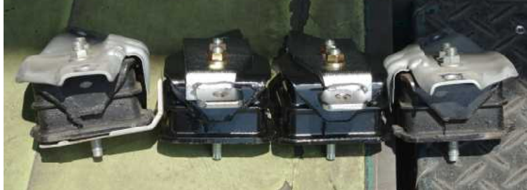
このように大雑把に並べても、マウント位置の違いが分かる