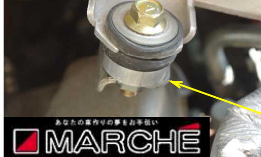
純正IC左側ブラケット