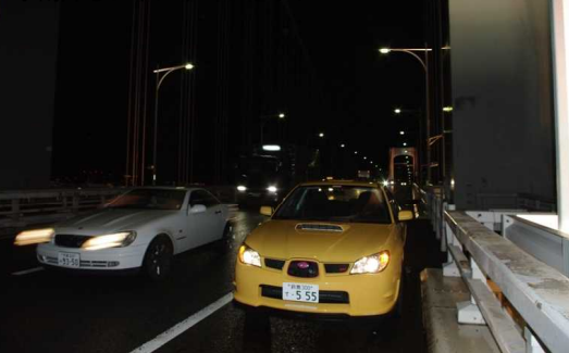
小雨降るレインボーブリッジ