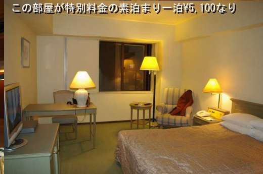
この部屋が特別料金の素泊まり一泊¥5,100なり