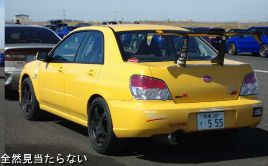
どこまでも続いてそんなこのスバル車の行列