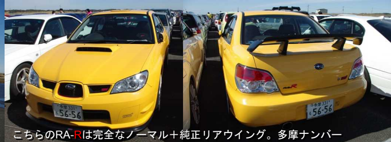
こちらのRA-Rは完全なノーマル+純正リアウイング。多摩ナンバー