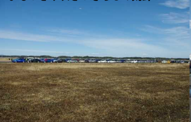
まるっきり吹きさらしの荒野