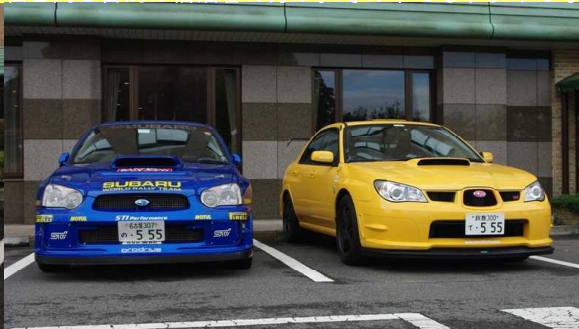
ゆまけん号を彷彿とさせます