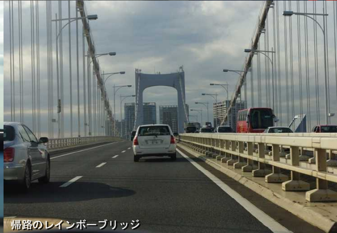
帰路のレインボーブリッジ