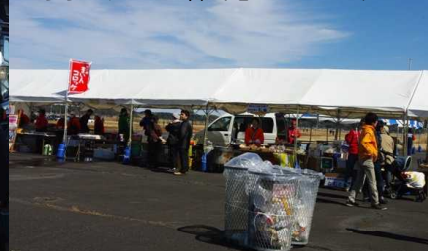
こちらのテントは御当地フードコーナー