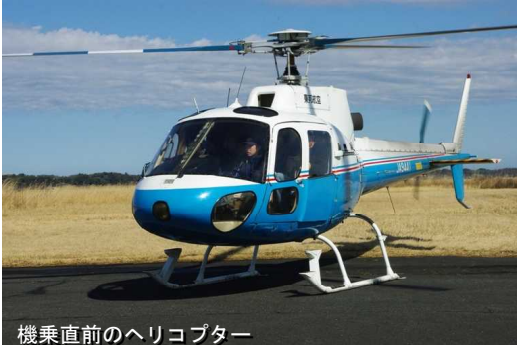
機乗直前のヘリコプター

2009年3月7日 ヘリによる空撮もほぼ終了して、ADVANステージトラックの舞台上では、カーモザイク・ギネス世界記録達成認定証の披露が行われた。そして予め申し込みを済ませておいた、ヘリの遊覧飛行によいよ生まれて初めてのチャレンジだ。約650名のカーモザイク参加者の中で、ヘリの遊覧飛行に申し込んだ人は約20名不足だった。5名ずつ機乗していくのだが、私は2組目に乗ることになった。5分程度のフライトで1組目が戻って、いよいよ私たちの番だ。私はパイロットの後ろの席に乗り込み、右端の席に座って係員の指示通りシートベルトを着用した。まもなくジェット機の離陸のような甲高いエンジン音が生じ、フワリと機体が持ち上がった。それからスゴイ急旋回を何度も繰り返しながら、カーモザイクの現場上空を飛び回った。こちらはとにかく夢中になってカメラのシャッターを切った。たった5分ほどのヘリコプター遊覧飛行体験だったが、ジェットコースターなどまったく目じゃないスリルを充分満喫させてくれた。程なくして離陸地点にもどって、着陸。あっという間の出来事だったが、沢山のカーモザイクの空撮写真も撮れ、これで4,500円とは安い！