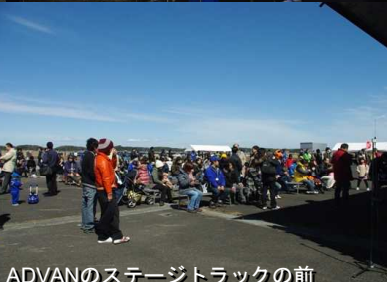
ADVANのステージトラックの前