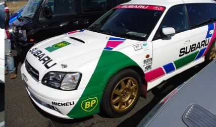
昔のSWRTワークスカラー