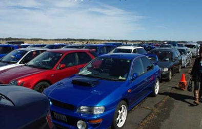
どのスバルも拘りの一台