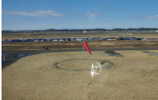
ヘリの遊覧飛行も瞬間に終焉