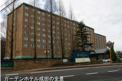
ガーデンホテル成田の全景