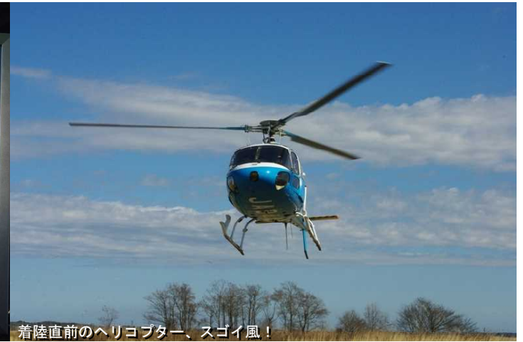
着陸直前のヘリコプター、スゴイ風！

2009年3月7日 ヘリによる空撮もほぼ終了して、ADVANステージトラックの舞台上では、カーモザイク・ギネス世界記録達成認定証の披露が行われた。そして予め申し込みを済ませておいた、ヘリの遊覧飛行によいよ生まれて初めてのチャレンジだ。約650名のカーモザイク参加者の中で、ヘリの遊覧飛行に申し込んだ人は約20名不足だった。5名ずつ機乗していくのだが、私は2組目に乗ることになった。5分程度のフライトで1組目が戻って、いよいよ私たちの番だ。私はパイロットの後ろの席に乗り込み、右端の席に座って係員の指示通りシートベルトを着用した。まもなくジェット機の離陸のような甲高いエンジン音が生じ、フワリと機体が持ち上がった。それからスゴイ急旋回を何度も繰り返しながら、カーモザイクの現場上空を飛び回った。こちらはとにかく夢中になってカメラのシャッターを切った。たった5分ほどのヘリコプター遊覧飛行体験だったが、ジェットコースターなどまったく目じゃないスリルを充分満喫させてくれた。程なくして離陸地点にもどって、着陸。あっという間の出来事だったが、沢山のカーモザイクの空撮写真も撮れ、これで4,500円とは安い！