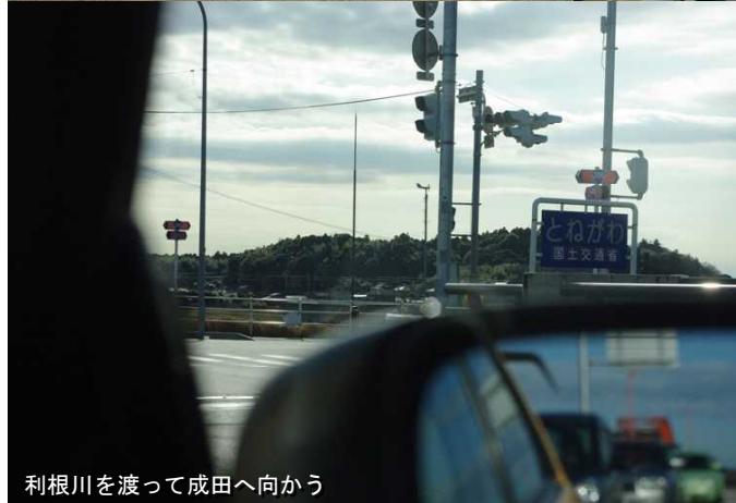
利根川を渡って成田へ向かう