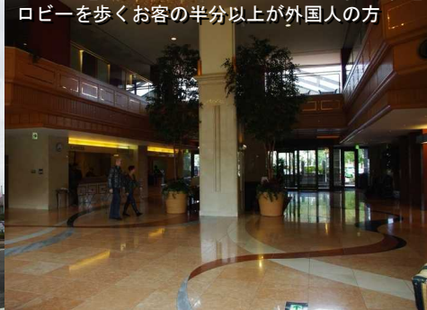
ロビーを歩くお客の半分以上が外国人の方