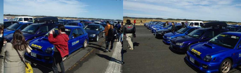
こうして見ると、やっぱりブルーが圧倒的に多いのがわかる