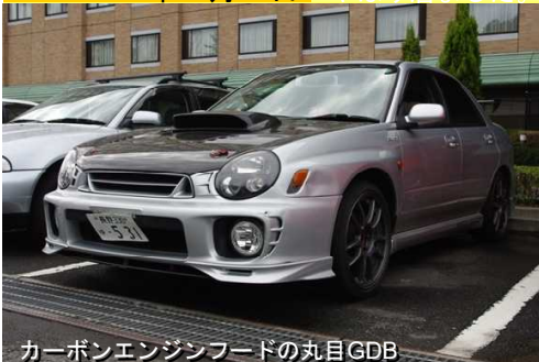
カーボンエンジンフードの丸目GDB

2009年3月7日 やはり居ました。私と同じ目的の宿泊客の方が。その中でもゆまけん号ばりのレプリカGDBの横にちゃっかり愛車RA-Rを移動して、ツーショットをパチリ！