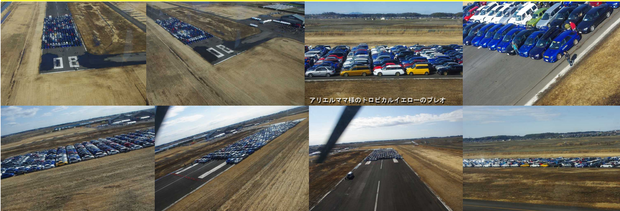
アリエルママ様のトロピカルイエローのプレオ

2009年3月7日 ヘリコプターからの空撮画像。本日のハイライト！茨城県竜ヶ崎飛行場に339台のSUBARU車で描いたシンボルマークの六連星。ブルーカラーの車が多いのでこの六連星は、当におあつらえ向きだったと思う。最初、350台程度の数でいったい何が描けるのかと少々不安だったが、この六連星を描くアイデアは抜群だった。これはギネスの世界記録に認定されても恥ずかしくないパフォーマンスだ！このために、北は秋田県から、西は広島県から、南は我々三重県からなど、本州の1都2府22県から約650名のスバリストがここに集ったのだ。それも決して安くはない、8,800円のエントリーフィーをわざわざ前払いしてだ。スポンサーやSUBARU本社の特別な援助もなく、皆が手弁当で駆け付けたわけだ。物好きと言われればそれまでだが、このスバリストの執念ともいえるこの挑戦は、もう既にその時点で成功だったと言えなくもない。特に主催して下さった、スバル・カーモザイク世界記録達成実行委員会の関係者の方々には、本当に頭の下がる思いで一杯である。さらに好天にも恵まれ、私にとって素晴らしい、貴重な体験の出来た一日であった。19年もの長きに渡った、SUBARUのWRCトップカテゴリー参戦に終止符が打たれ、新たな挑戦の始まりに相応しい一大イベントとなった。今は亡き久世隆一郎初代STI代表取締役も天国で喜んでおられるだろう。