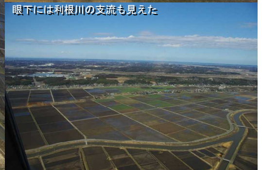
眼下には利根川の支流も見えた