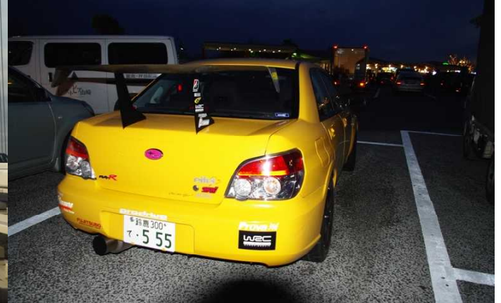
午後6時過ぎには浜名湖SA

2009年3月7日 素晴らしい一日が、そろそろ終わろうとしていた。ヘリの遊覧飛行の後にはmotoprinさんらと会うこともなく、名残惜しくはあったが、まだ興奮の覚めやらぬ内に、竜ヶ崎飛行場のカーモザイク・イベント会場を後にした。午後3時に成田。後は一路鈴鹿を目指して高速をひた走るだけ。午後8時半帰宅。私の一生の思い出となったこの2日間であった。