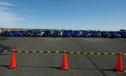
カーモザイクの最前列