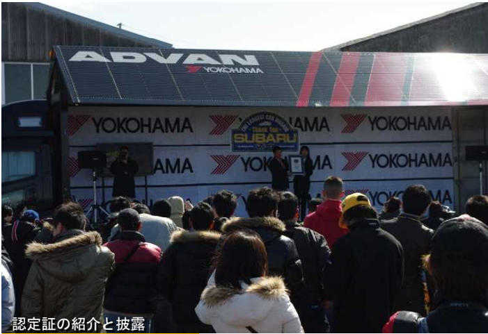
認定証の紹介と披露