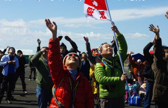
流石はmotoprinさん、Rally Japanののぼりを持参