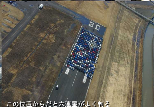
この位置からだと六連星がよく判る