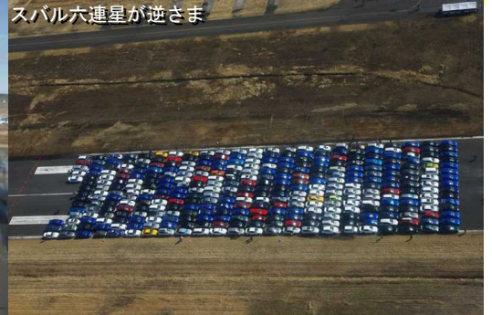
スバル六連星が逆さま