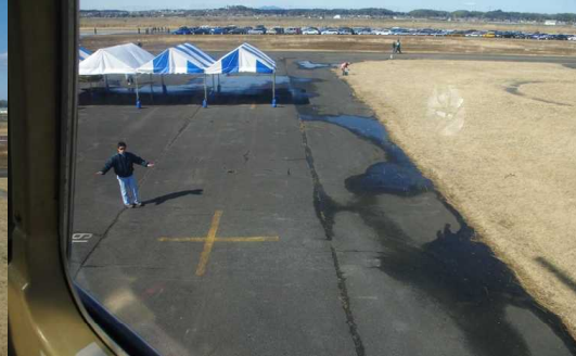
着陸体制に入ったヘリ