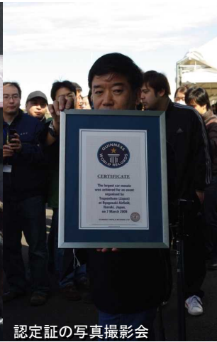
認定証の写真撮影会