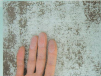
手に粉がつく場合 →増し塗りを実施してください。