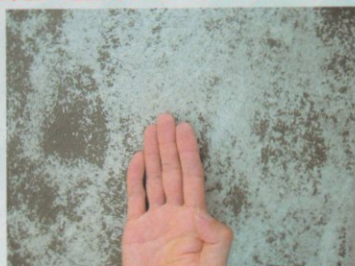
手に粉がつかない場合 →増し塗りをする必要はありません。

〈参考写真〉 ※下塗り乾燥後に、塗装面を手で触り粉がついた場合、上塗りとの付着不良をおこす可能性がありますので、増し塗りを実施してください。