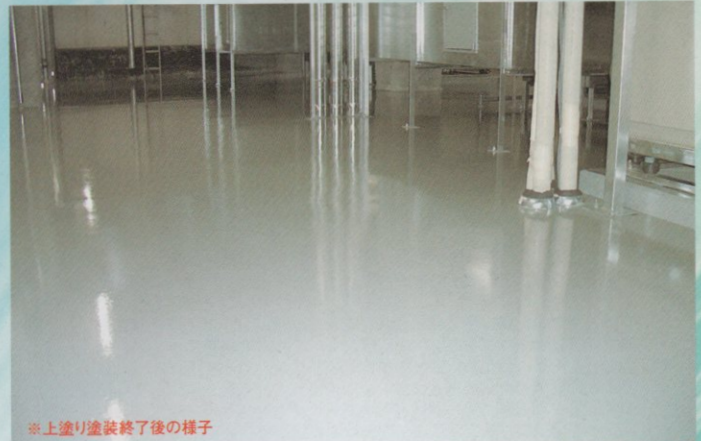
※上塗り塗装終了後の様子