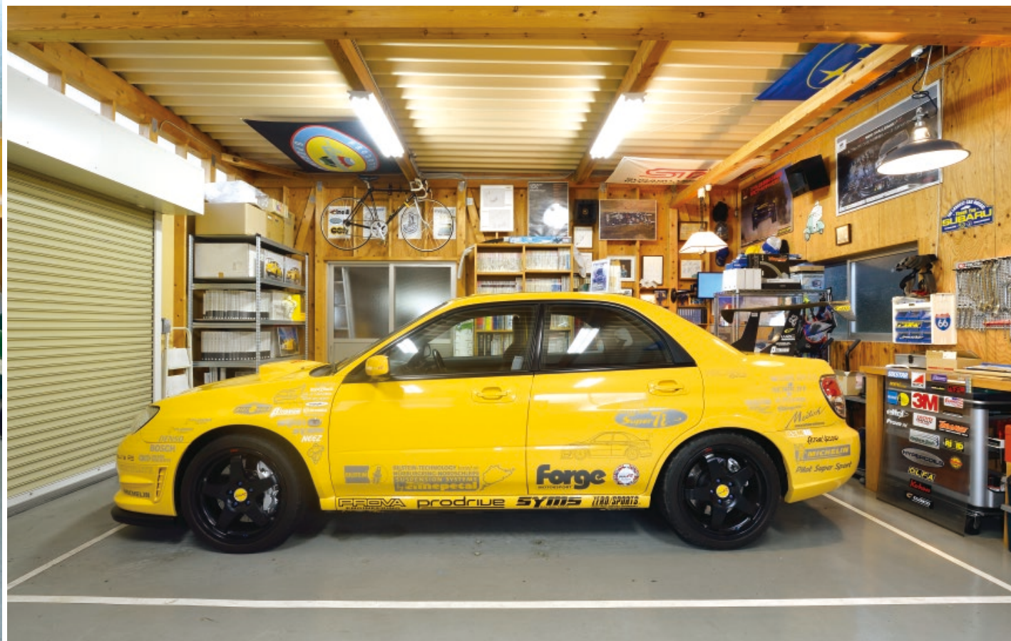
『NEEZ』でオーダーし富山のホイールメーカー「鍛栄社」で製造され購入した鍛造マグネシウムワンピースホイールSEK18インチを履く、現在の愛車スバル・インプレッサ・WRX STI spec C type RA-R。アストラルイエローを纏うクルマは50台しか生産されていないとか。

ガレージでチェックするのは主にオイル交換や足まわりのチェック。あらかじめセラミック製アンカーを埋め込み、Summitで輸入したリフトを導入して110cmまでクルマを上昇させることが可能になった。